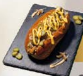
2 Carpe Diem