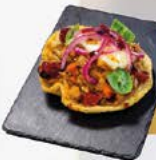
8 Bar Shalom