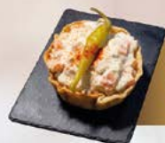
1 Bar Puerto Madryn