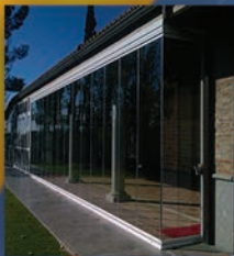
CORTINAS DE VIDRIO