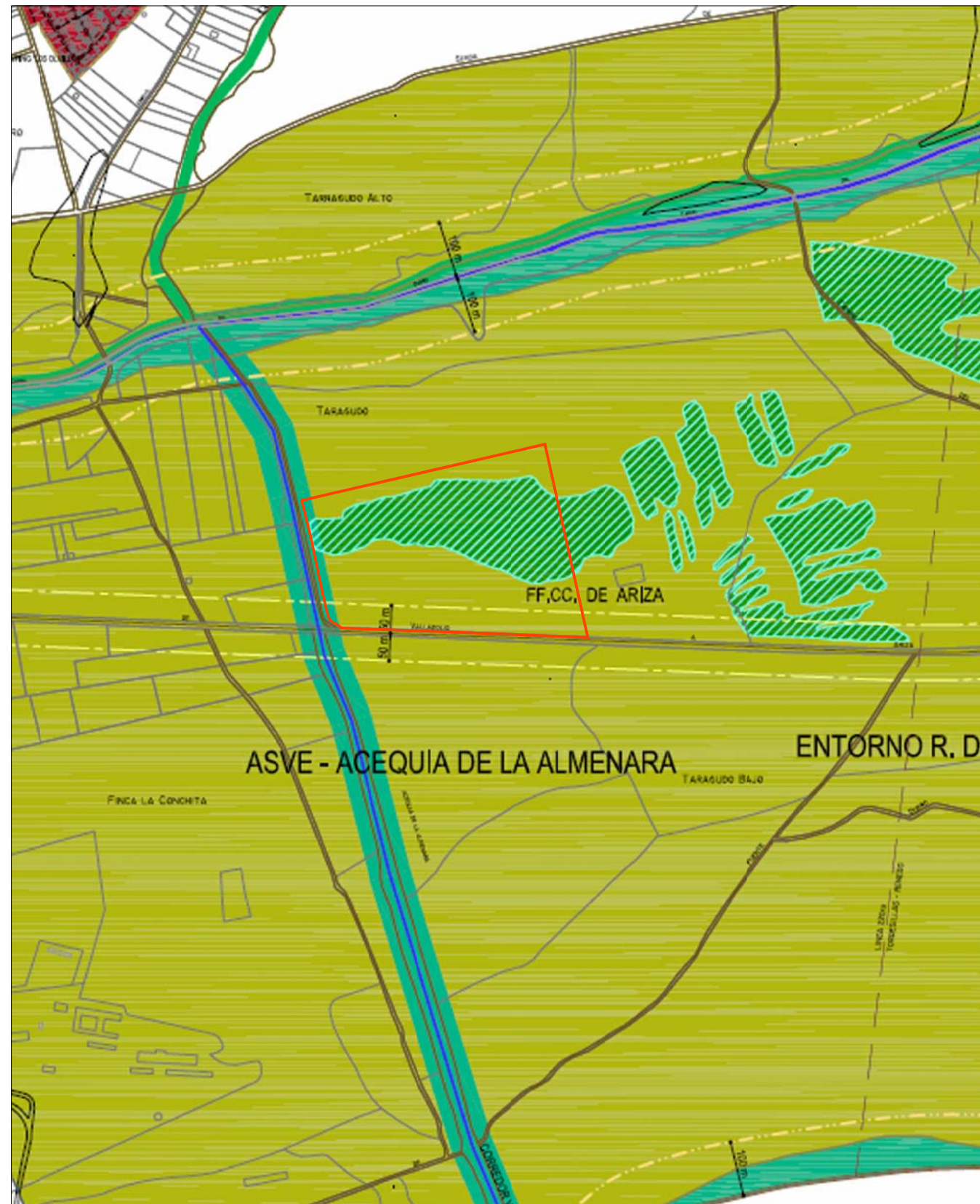
PGOU. ESCALA 1:10.000