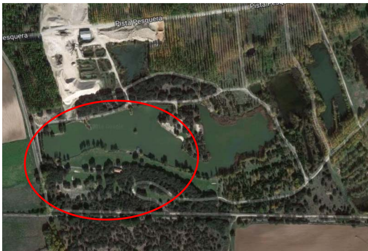
Vista aérea de la parcela.