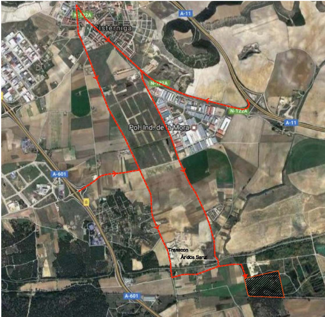
Esquema de las distintas vías de acceso a la parcela.