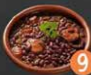
9 Hotel San Cristóbal FEIJONADA BRASELETA (ALUBIA NEGRA) CON SU ARROZ BLANCO, SU COMPANERO DE CERDO Y SU MARRAJA