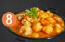
8 La Cueva del Rey GARBANZOS CON LANGOSTINOS Y MAPLE