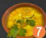
7 El Faro SEPIA CON BATATA