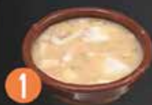
1 Sidreria Asgaya ALUJOS CON SEPIA