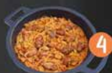
4 Rte. Quisqueya FIDEOS FRITOS Y COSTILLAS DE CERDO