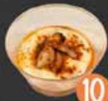
10 Portazgo Hostel CREMA DE ARAÑEADOS CON MARRASCO A FEJARI

66 ¡Solicita tu papeleta para participar! 99