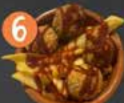
6 Carpe Diem ALBONDIGAS CON PATATAS FRITAS Y TOMATE