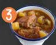
3 Vikoka PATATAS CON COSTILLA ADOBADA