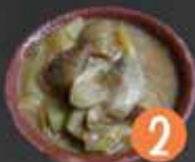
2 Bar Sonia PATATAS CON SEPIA