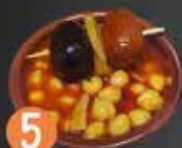
5 Plan B COCIDO